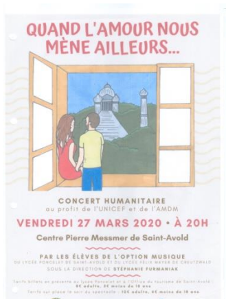
2020 Concert du lycée Poncelet : Quand l'amour nous mène ailleurs